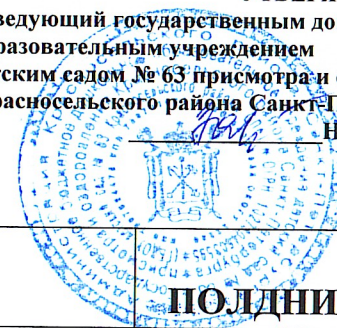
ГРАФИК ВЫДАЧИ ПИЩИ на 2024-2025 учебный год (01.09.2024-31.08.2025)